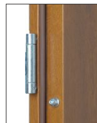
Zawias + bolce antywyważeniowe