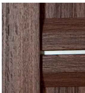
modele S/3D, S/4D, S/SD

Informacje techniczne: str. 69 Informacje o ościeżnicach: str. 66 Drzwi dwuskrzydłowe, dostawka w rozm. 40: str. 83 Skrzydła przesuwne: str. 64-65 Skrzydła bezprzylgowe: str. 74-75